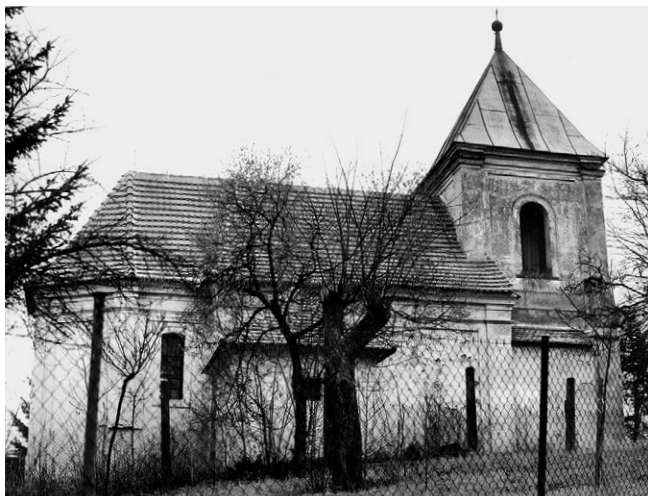
Kostel sv. Anny, rok 1994

ze Soutic, kterému 1. září 1509 Žumberk a tvrz Lukavici vypálil Jiřík Býchorský (známý zemský škůdce), a rok poté 14. října 1510 Jan Janovský ze Soutic prodal hrad Žumberk s dvorem a městečkem, zmíněnou tvrz Lukavici a další vsi, mezi nimi i Smrček, za 2000 kop Mikuláši mladšímu Trčkovi z Lípy. Tento obchod byl po letech pravděpodobně zrušen, neboť znovu v roce 1529 jsou uváděni Janovští jako majitelé Žumberska, Orelesa a Zaječicka. Jsou to Karel, Hynek a dva bratři Aleš a Petr, pravděpodobně synové zemřelého bratra prvních dvou