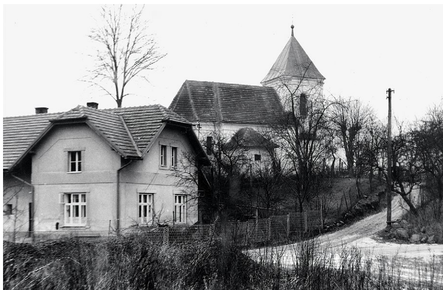
Pohled na kostel sv. Anny, rok 1973, foto V. Milská

s dvěma podsedky 82 a podacím kostelním 83 a díl ve Švihově jako odúmrtí královská povolány. 84 Kvůli tomu byla u dvorského soudu vedena pře, majetku se domáhali zmíněný Apolon z Křivan a Petr Kapoun jménem svých synů. Ten „roku 1443 právo své u soudu dvorského provedl, nicméně podržel zboží Apolon z Křivan, jenž spustlou tvrz znovu vystavěl.“ 85 Roku 1464 Apolon z Křivan postoupil tvrz ve Smrčku i s poplužním dvorem a vsí Janu Horynovi z Honbic, ten o svůj majetek vedl pře u dvora. Petr Kapoun se snažil vyprosit na králi věno po své tchýni Jitce, vdově po Arnoštovi. Jan Horyna se výsledku nedožil, jeho potomkům majetek zůstal (roku 1465). Později se Smrček stal součástí Žumberského panství. V roce 1473 postoupil Mikuláš Bochovec z Buchova a na Žumberce svému synovi Žumberk, toto panství rodině dlouho nepatřilo. Dalším majitelem byl Mikuláš z Holohlav, který roku 1487 sepsal dlužní zápis na 500 kop na zboží Žumberské Benešovi a Jindřichovi ze Sendražic, Janovi a Prokopovi bratřím z Holohlav, svým strýcům, na způsob závěti. Zde je uveden soupis tohoto panství, ke kterému mimo hradu Žumberku, dvora a městečka patřilo několik dalších vesnic a mezi nimi i Smrček.