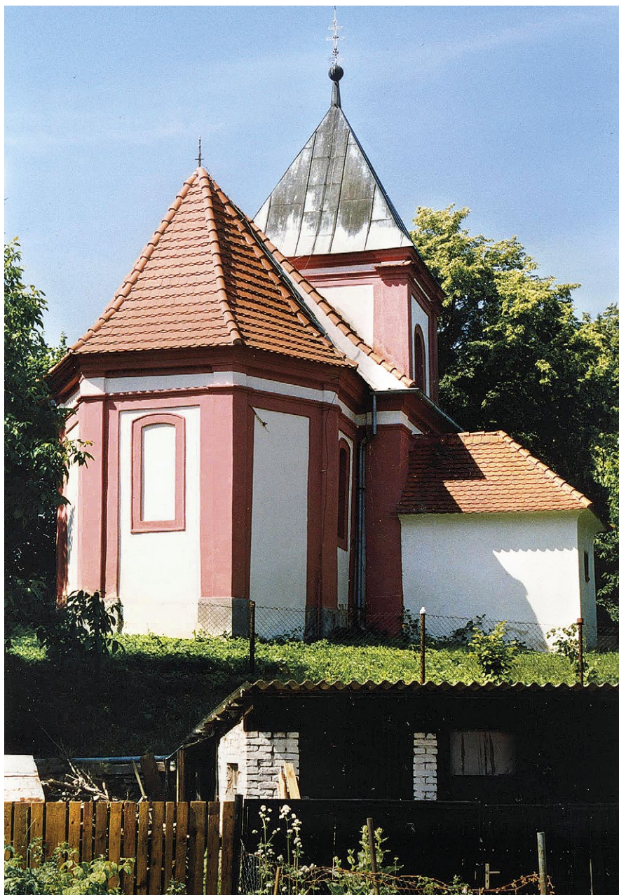
Kostel sv. Anny po obnově, rok 2002